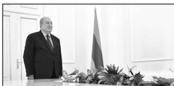
շարունակությունը՝ էջ 2

Հանրապետության նախագահ Արմեն Սարգսյանը նախաձեռնել էր առցանց դասախոսությունների շարք, որի նպատակն է ստեղծված իրավիճակում հեռավար ուսուցման մեթոդի կիրառմամբ ուսուցման շարունակականությունն ապահովել ուսանողների համար: